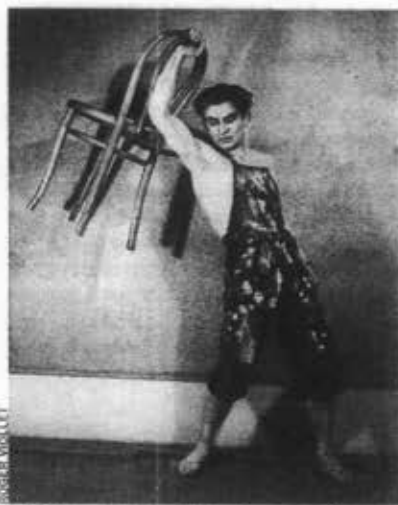
Un frisson de vie sublime tous ses rôles. Jean Babilée, une sauvagerie maîtrisée.