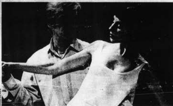
Jean Babilée "échappe à toutes les idées qu'on a de la danse, du théâtre..."

De fait, dans cette pièce abstraite, épurée, Babilée rayonne de cette sauvagerie maîtrisée qui en fit l'un des dan-