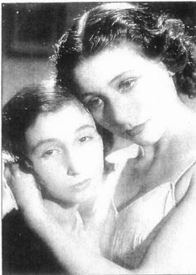
Janine Charrat et Yvette Chauviré.