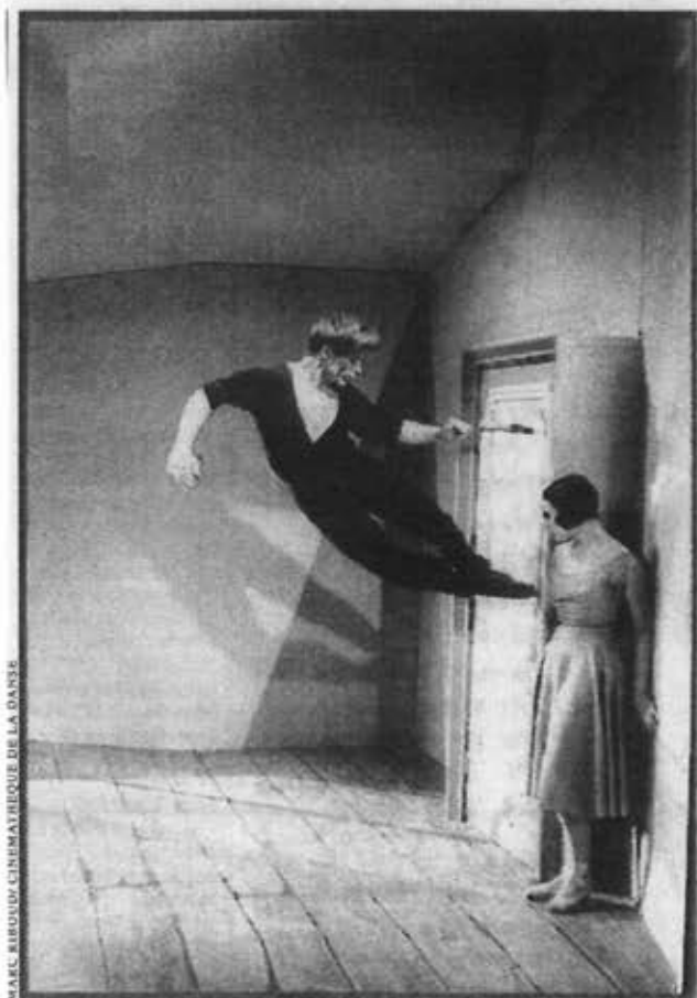
Jean Babilée dans «le Poignard».