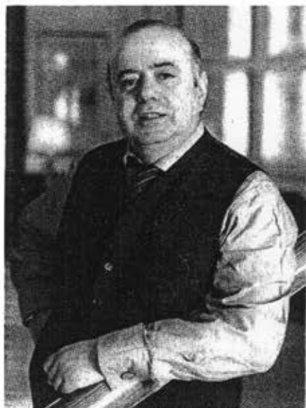
Sara Krulwich/The New York Times